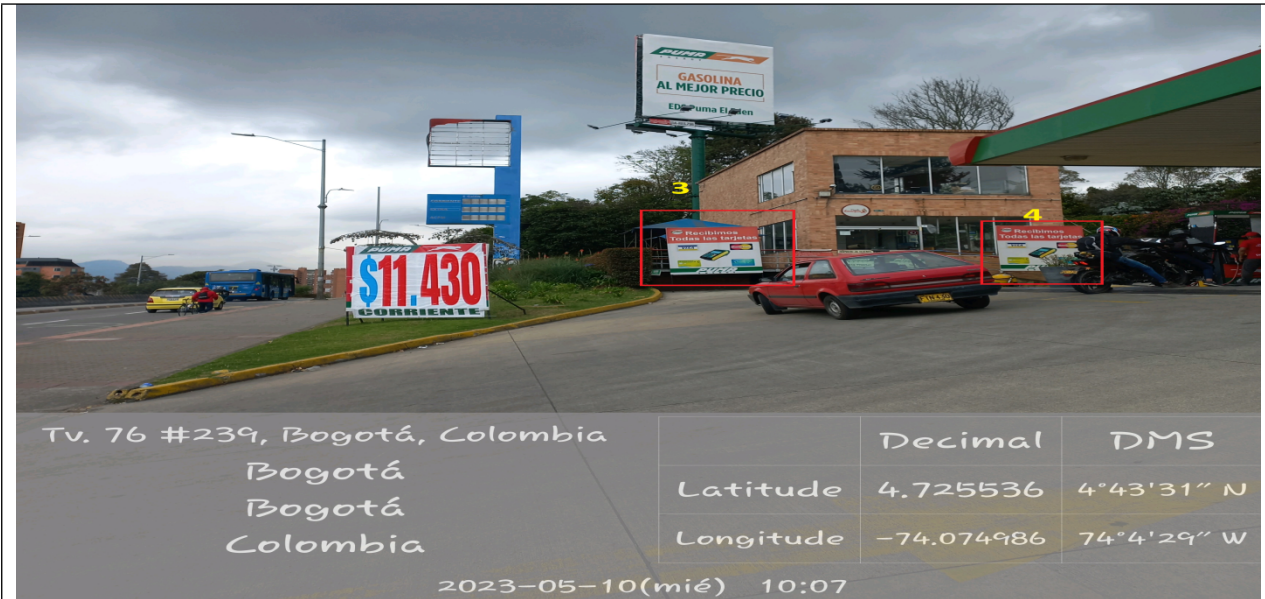
Foto panorámica de la estación de servicio donde se evidencian dos (2) elementos no autorizados identificados con No. 3 y 4 los cuales se encuentran en área que se constituye espacio público